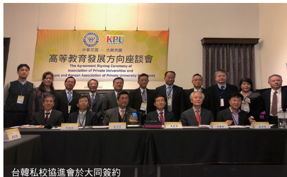
台韓私校協進會於大同簽約

「打破一對一互相交換的方式，而是有意願的學校都可以參與」，對學生來說，等於選擇更彈性、更多樣。預計今年八月進一步落實這個計畫，讓雙方學校、學生都能有更多學習機會。