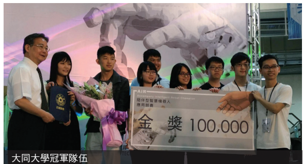
大同大學冠軍隊伍

大同大學跨領域能力以及自造者精神，獲得各界肯定。中科管理局為鼓勵大眾積極參與智慧機器人應用領域，培育自動化產業人才，透過中科智慧機器人創新自造基地與大同大學連結，擴大創造應用推廣效益。