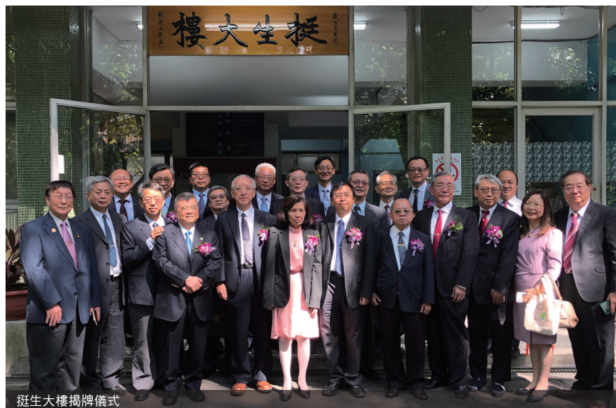
挺生大樓揭牌儀式

林前校長的信念，作為辦學和教育的最高指導原則，大同才能培養出這麼多優秀的人才。挺生大樓的定名，象徵新的開始。全校師生努力、校友全力支持，是大同最大的支持，未來也是要朝著精緻、優質頂尖的方向前進。