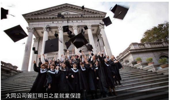
大同公司簽訂明日之星就業保證

連續兩次獲得尚志獎學金的同學，向校方報名，即可獲得印有自己名字的「未來錄取通知書」。每年只有五個名額，超過名額則由評審委員擇優率取。憑著未來通知書，同學在畢業後三個月，就可以選擇到大同相關集團面試，依照個人專長、興趣以及公司的開缺，至少安排兩個面試單位，保證錄取。如果要繼續升學或是當兵，等到畢業或是退伍後，通知書依舊有效。