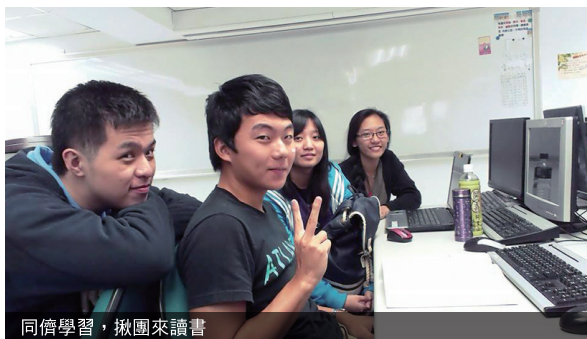
同儕學習，揪團來讀書

不孤單」。這幾次觀察下來發現，參加同儕力量大的同學，不管是功課追得比較吃力，或是成績比較好的，都可以重新找到學習的方法，鼓勵大家多多參與。